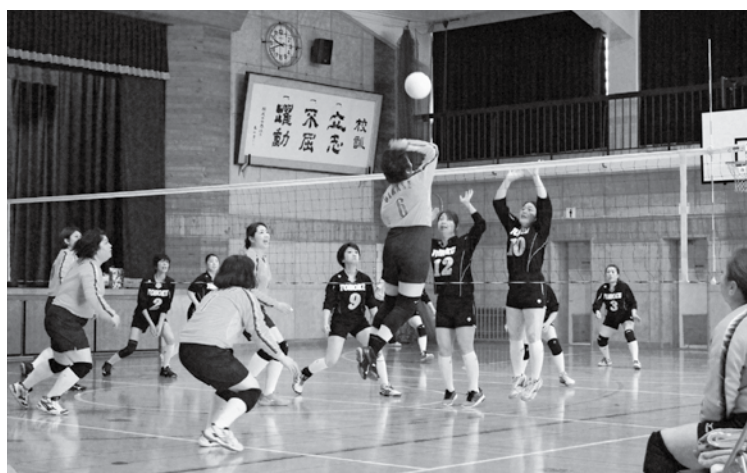
3年連続優勝のママさんバレーボール