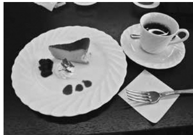
食後のスフレチーズケーキとコーヒー（5～6月）