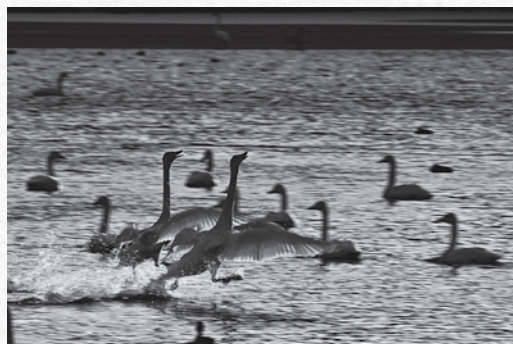
〔白鳥部門〕平成30年度 最優秀賞作品