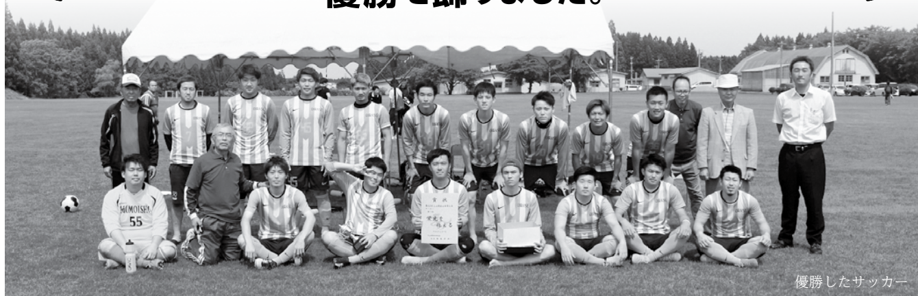
優勝したサッカー

おいらせ町の総合優勝は平成22年以來9年ぶり 種目別では、ママさんバレーボールが3年連続で 優勝を飾りました。