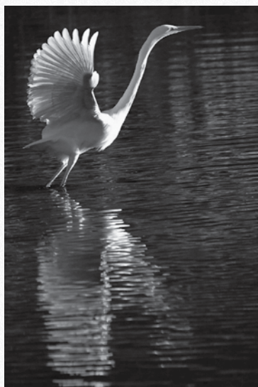
〔野鳥部門〕平成30年度 最優秀賞作品