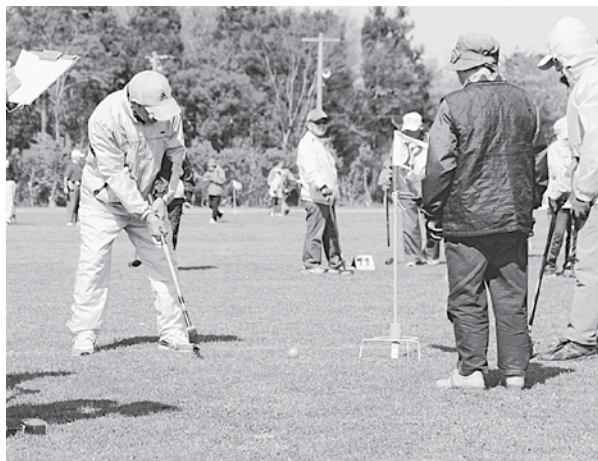
グラウンド・ゴルフを楽しむ参加者▶

おいらせ町民の融和を目的に始まったこの大会は、今年で14回目となります。なお、大会の結果は、1位が三田町内会、2位が錦ヶ丘町内会となりました。