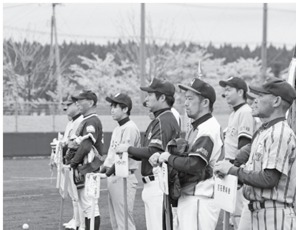
朝野球大会に参加するチーム▶

また同日には王松旗争奪野球大会も開催され、優勝は、ピーチストーンクラブとなりました。