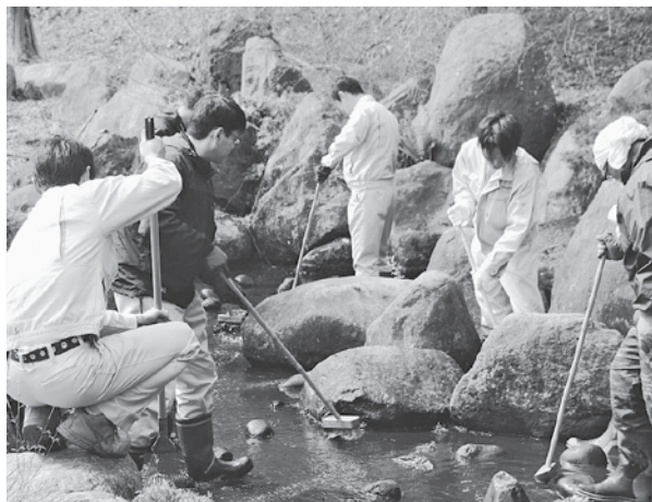
下田公園内を清掃する参加者たち▶

当日は、両公園とも桜が咲き始めており、参加者からは、春の訪れを喜ぶ声が聞こえていました。