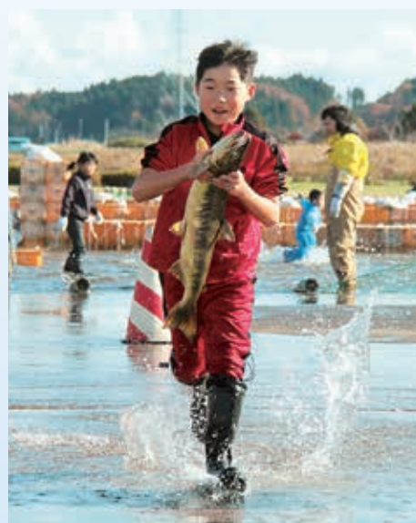
▲鮭をつかむ早さを競う「早づかみゲーム」