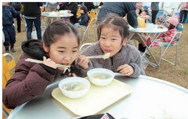
▲大好評の「鮭汁」を味わう子どもたち