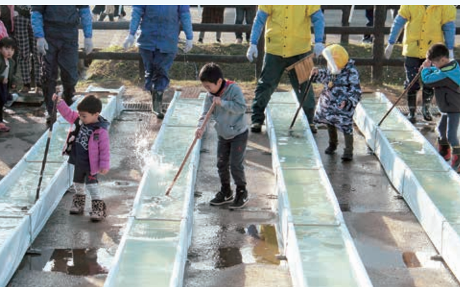
▲白熱したサーモンレース