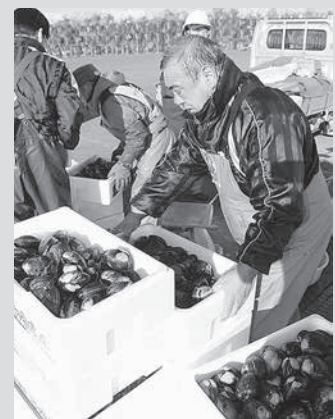
【今月の表紙】百石漁港におけるホッキ貝漁水揚げの様子（12月3日撮影・関連記事4頁）