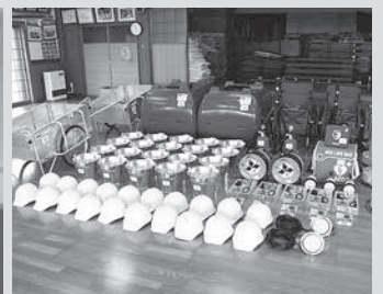
▲整備した防災装備品など

★これらの事業は、宝くじの社会貢献広報事業として、宝くじの受託事業収入を財源として実施しているコミュニティ助成事業です。