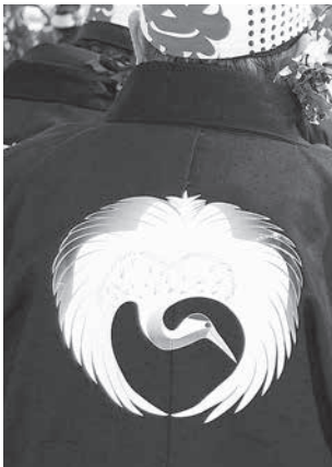
▲百石えんぶり組の羽織(一羽鶴マーク)