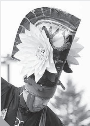
▶「ながえんぶり」は赤い牡丹や白いウズキの花がついている