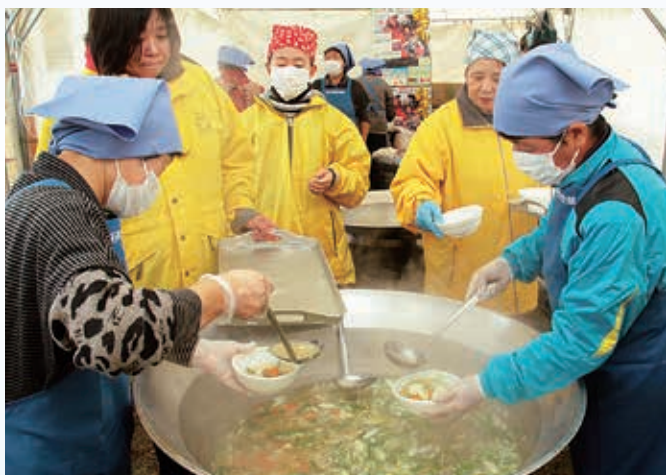
▲「鮭汁」を調理する百石町漁協女性部

おいらせ町最大のイベント「日本一のおいらせ鮭まつり」が、11月17日・18日の2日間にわたり、しもだサーモンパーク（奥入瀬川河川敷）で開催されました。両日とも好天に恵まれ、会場は大勢の家族連れや団体客で賑わい、2日間でおよそ2万3千人が来場しました。 目玉イベントである「鮭のかみ取り」は、今年も大盛況。県外や米軍三沢基地からも多数の参加がありました。さらに、ユニークな格好の参加者に贈られる「スタイルコンテスト」を狙って、コスプレや水着で鮭を追いかける人の姿もあり、会場を大いに沸かせました。 また、百石町漁協女性部が作る「鮭汁」や、おいらせ町商工会青年部による「鮭ちゃんちゃん焼き」などのコーナーも大人気で、多くの人が温かい鮭料理を味わいました。 鮭まつりは来年も11月中旬に開催予定です。ぜひお越しください。