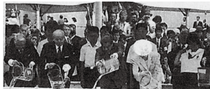
◀参考写真出典：三沢市『三沢市史 続通史編』平成20年