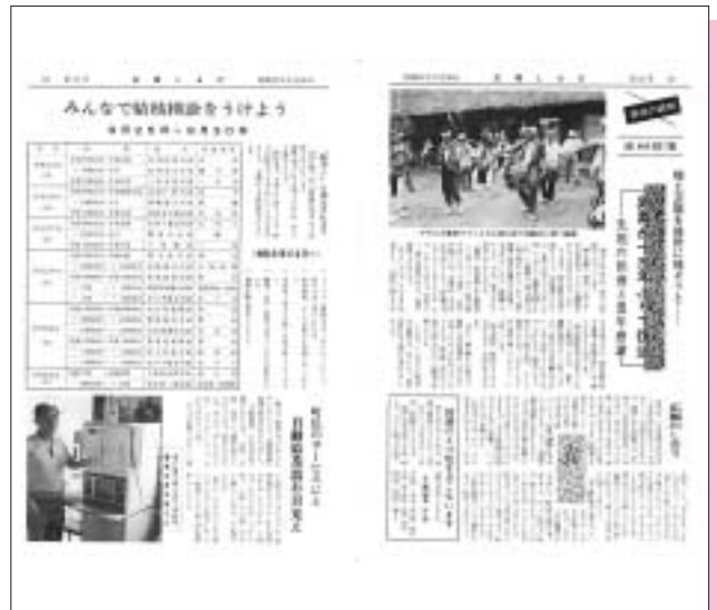
昭和47年8月号（第21号） 鶏舞が13年ぶりで復活