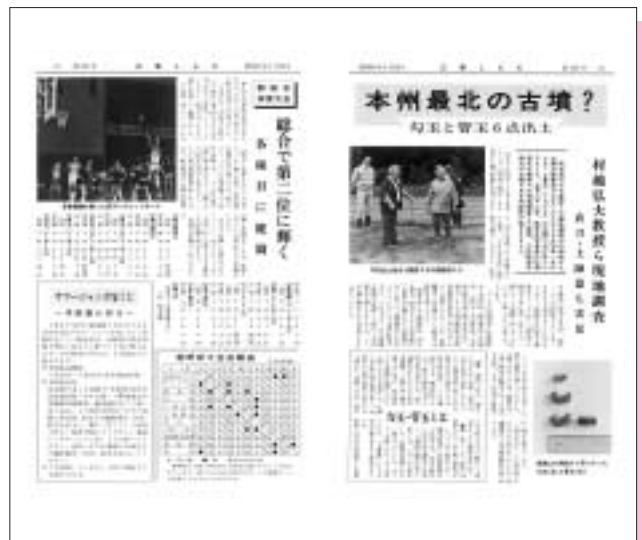
昭和62年 6月号 (第196号) まがくた 勾玉と管玉が出土 (阿光坊遺跡)