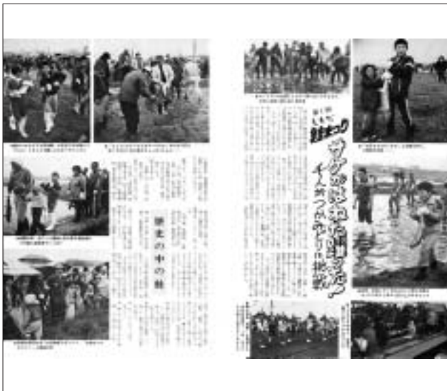
昭和60年11月号 (第178号) 第1回しもだ鮭まつり開催