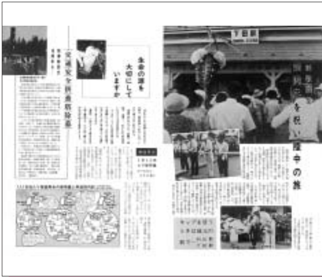
昭和56年 8月号 (第127号) 下田駅開業90周年