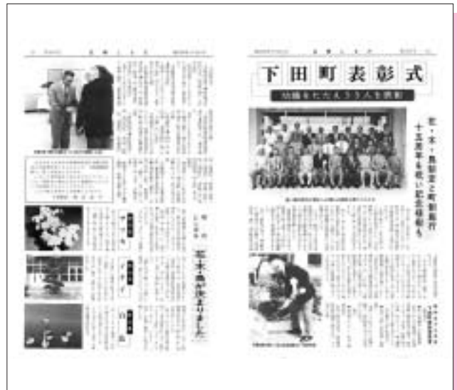
昭和59年 8月号 (第163号) 町の花・木・鳥が決まる