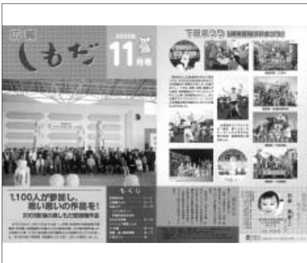
平成15年11月号(第391号) 2003彫刻の森しもだ彫刻制作会