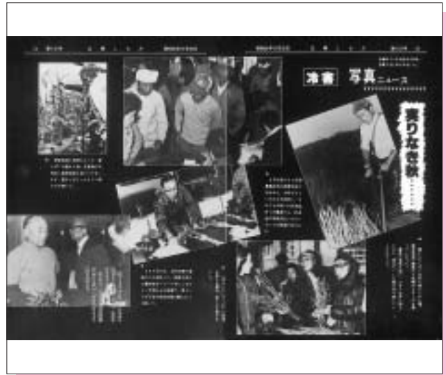
昭和55年 9月号 (第116号) 冷害写真ニュース