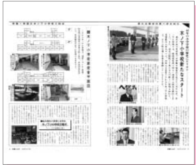
平成4年2月号(第250号) 木ノ下小学校入校式