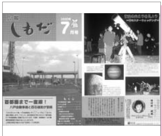
平成14年7月号(第375号) 八戸自動車道と百石道路が接続