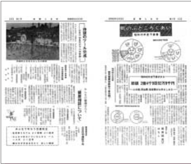
昭和45年8月号（創刊号） 木ノ下小中学校プール完成