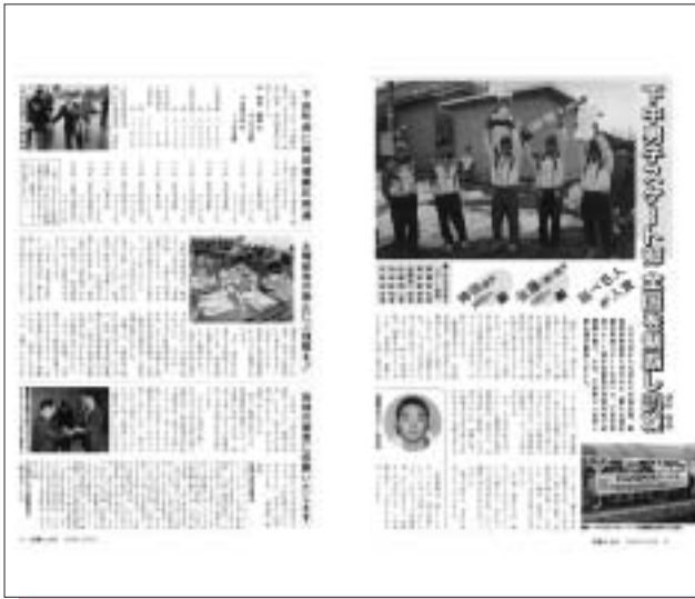
平成7年3月号(第287号) 下田中学校男子スケート部全国優勝