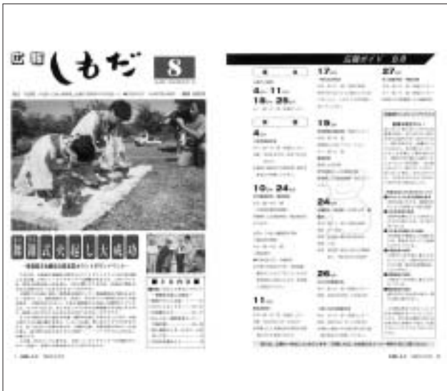
平成10年8月号(第328号) 舞錐式火起し大成功 (青森県文化観光立県宣言カウントダウンイベント)