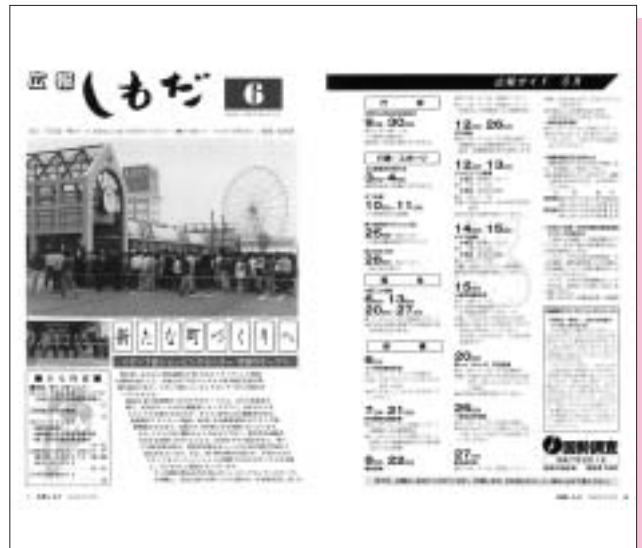
平成7年6月号(第290号) イオン下田ショッピングセンターオープン