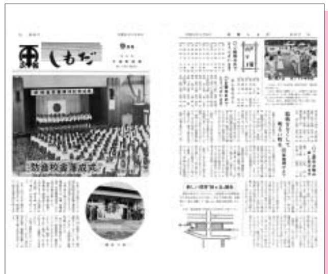
昭和51年9月号（第69号） 下田中学校防音校舎落成式