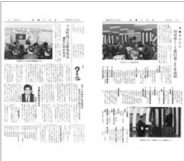
昭和49年2月号（第39号） 下田町商工会館落成式