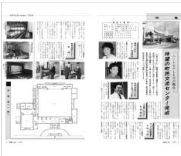
平成2年 8月号 (第233号) 町民交流センター完成