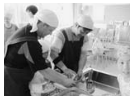
慣れない調理に悪戦苦闘する親子

親子で、家庭でも簡単に作れるメニューということで、料理実習「中華料理体験と試食」と「食育」についての講話をいただきました。