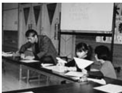
どんな紙飛行機ができるかな

みんなで思い思いの絵を描いたり色をぬったりして、自分だけの紙飛行機をつくり、上手に飛ばすことができました。また、その紙飛行機を使って、大きさの違う穴に点数をつけて、高い点数のボードをめがけて飛ばす紙飛行機大会を行いました。1年生から6年生までハンディなしで競い合い、低学年に負けて悔しがる高学年の子もいましたが、楽しく盛り上がることができました。