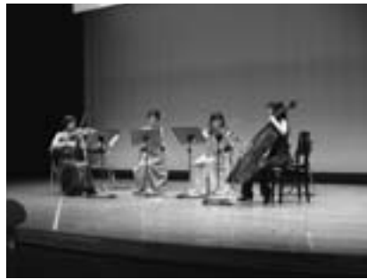
優雅な弦楽器の音色に酔いしれました

ハートピアもだ音楽の夕べ「弦楽四重奏 drop コンサート」を12月9日、町民交流センターにて開催しました。