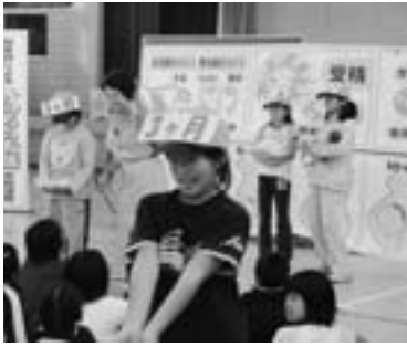
おなかの赤ちゃんを模擬体験

小学4年生は思春期の始まりであり、この大事な時期に専門職である助産師からアカデミックな指導を受けることで、児童が性に関する正しい知識と理解を深められました。