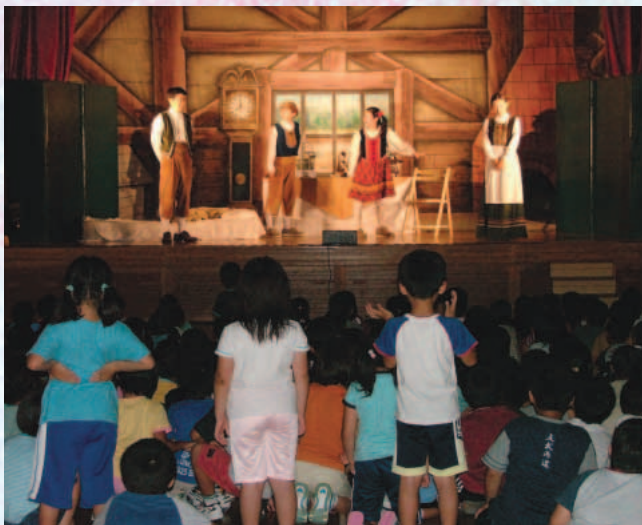
劇団「め組」の迫真の演技に見入る児童たち

9月12日(月)、木ノ下・木内々の両小学校で、小学校低学年芸術文化観賞事業(演劇)「あおいとり」が行われました。