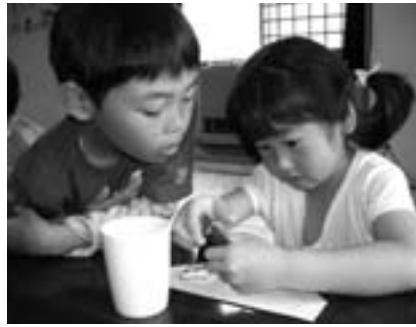
「早く食べたいね」(大杉っ子教室)

地域子ども教室推進事業は、近年の青少年に関する事件等に対応し、子どもたちが安心かつ安全に過ごすことのできる居場所を確保するとともに、地域の方々が子どもたちの活動に関わることにより、地域の教育力を高めることを目的とする事業です。文部科学省により平成16年度から実施され、全国で子どもの居場所づくりが展開されています。 当町では本村地区「コミュニケーションセンター」伝承館に「大杉っ子教室」、中央公民館に「わ