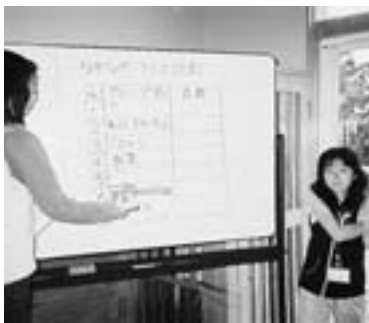
「なぞなぞ難しいね」(太陽っ子教室)

6月4日、「なぞなぞ大会」を行いました。子どもたちはグループになって、本を調べながら自分たちの問題をつくり、みんなでなぞなぞを出しあいました。 太陽っ子教室は、毎週土曜日の9時から12時まで開催しています。