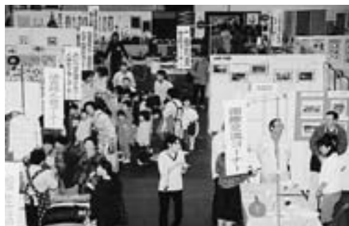
盛況だった昨年度のフェスティバル

他にもさまざまな学習機会を提供していますので、自分にあった学習方法を選び楽しく人生を過ごしましょう。