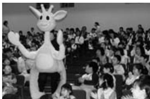
大きなぬいぐるみに子どもたちも大はしゃぎ

劇団のおにいさんとおねえさんが、かわいいぬいぐるみと一緒にステージに登場すると、子どもたちの大きな歓声が上がりました。大きな人形はステージだけでなく、会場の子どもの席までやってきて、人形に触れた子どもたちは、「かわいいー」、「やわ