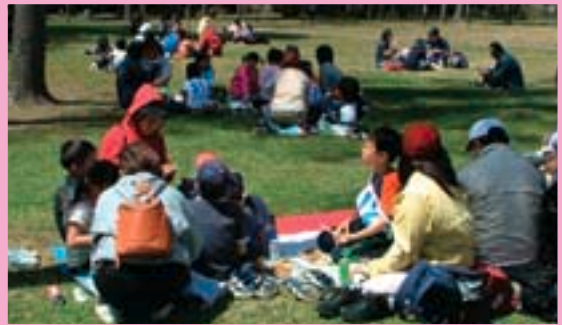
「親子追跡ハイキング」では、公園内の各場所に設置したクイズを解きながら歩きます。家族で協力しあいきずなが深まりました。