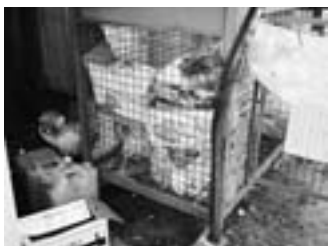
住吉町内会のあるごみ収集場所。毎回収集日には、ルール違反で収集されないごみがいっぱいに…このような状態が続き、ごみ収集場所が撤去されてしまいました。

「皆さんがいつも何気なくごみを出している収集場所がどんな想いで置かれているかもう一度考えてみましょう。」