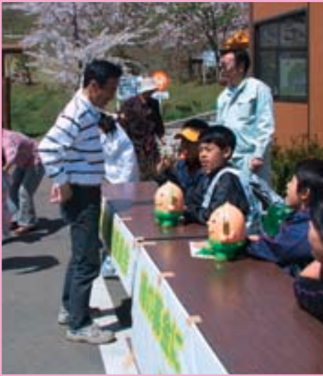
緑化推進のため、町内の児童たちが公園内で緑の募金を行いました。たくさんの方々から募金していただきました。

下田公園では、親子追跡ハイキングをはじめとするさまざまな催しが行われ、たくさんの親子連れなどが訪れ、春を満喫しました。