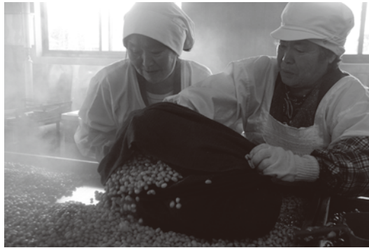
▲熱気の中、蒸しあがった大豆を丁寧に冷ます。 ▲平均年齢72歳、ベテランの仕込み作業