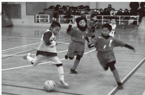
▲ゴールを目指し競り合う選手たち

また、協賛する日本フードパッカー（株）から各優勝チームに豚肉肩ロース10kgが副賞として贈呈され、大会を盛り上げました。