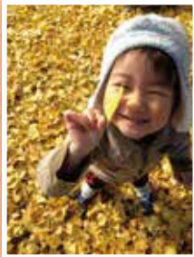
町民の笑顔 最優秀賞『銀杏色の笑顔』