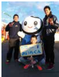
「奥入瀬川の恵みと笑顔あふれるまち」の情報誌

「分かりやすい言葉、なじみやすい旋律が特徴。作詞作曲はすべて自作。現在は別の仕事の合間をぬって、首都圏を中心にライブ活動中。2月13日、町社会福祉大会で弾き語りのミニコンサートを開催。アンコールの後、満場の拍手を浴びました。」