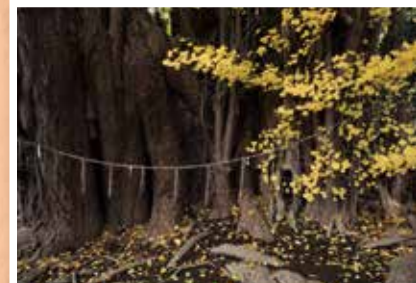
四季の景観 最優秀賞『御神木』