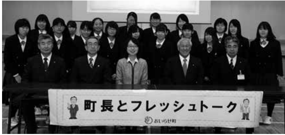
▲意見発表をした代表生徒たちと記念撮影。 真剣な表情で回答に耳を傾ける▶