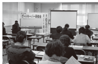
◀みさわの森クリニック 植西院長による『高齢者の自殺予防』研修会