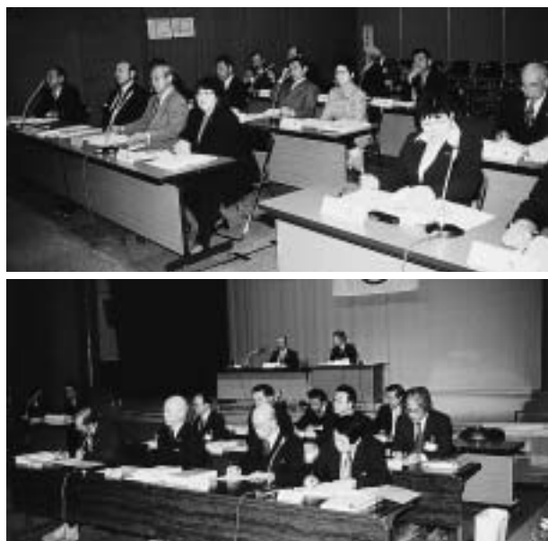
臨時会のようなす