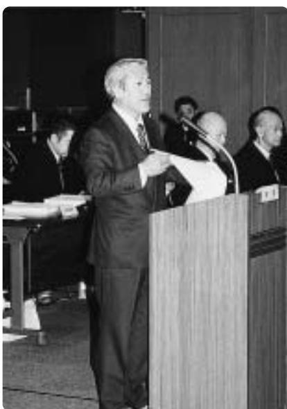
三村町長職務執行者