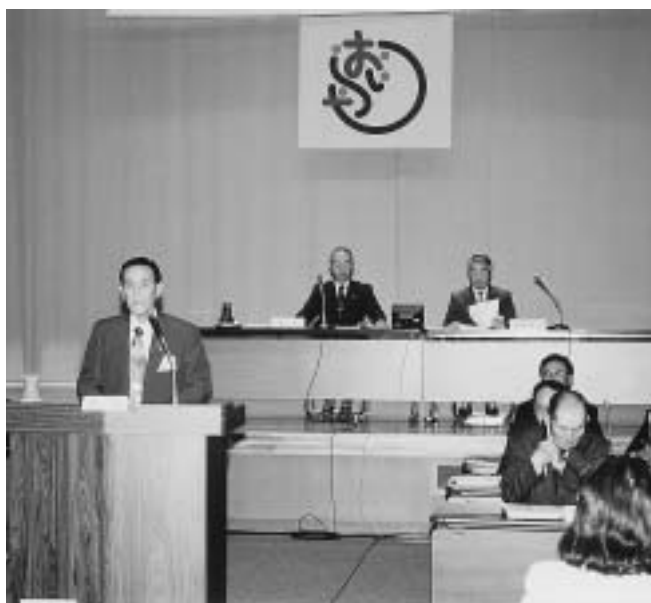
委員長報告をする北向議会運営委員長 (左)