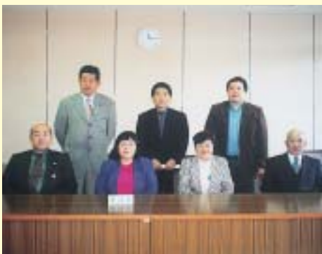
編集委員です ヨロシク