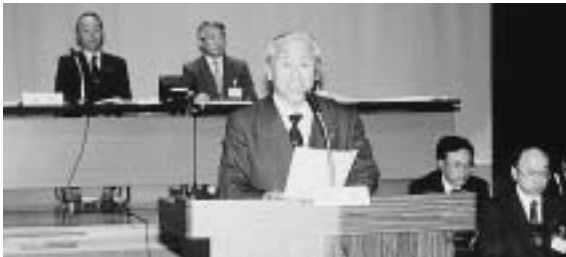
提案理由を述べる三村町長

教育委員会委員5人、監査委員2人、固定資産評価審査委員会委員3人、選挙管理委員会委員4人及び補充員4人が決まる