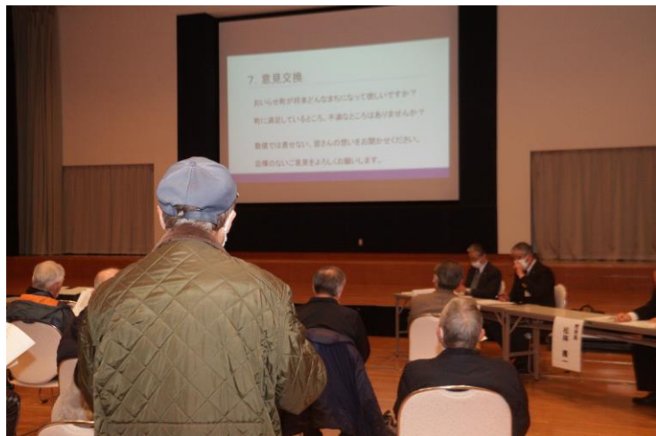
2月16日(木) ▶ みなくる館会場