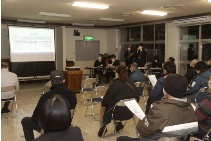
◀ 2月15日(水) 中央公民館会場