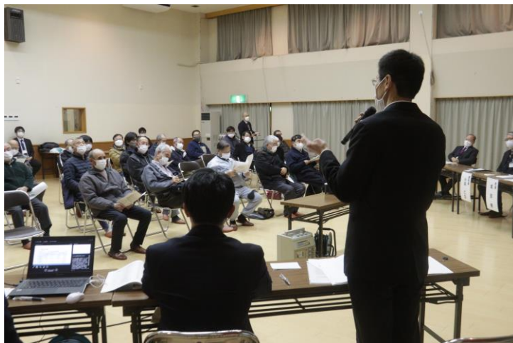
◀ 2月17日(金) 北公民館会場