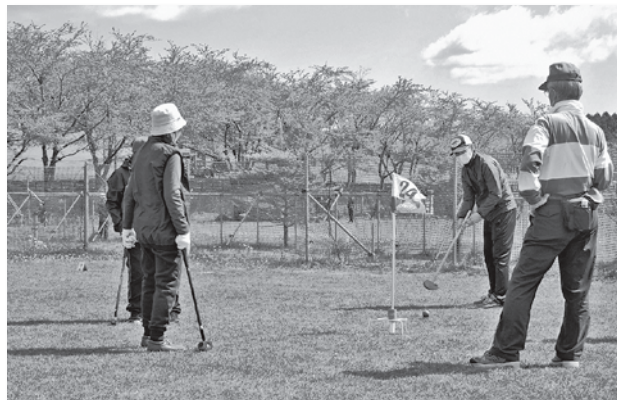
▲グラウンド・ゴルフを楽しむ参加者

今年は各町内会から19チームが参加。良く晴れた青空の下、参加者は、マスクの着用などの感染防止対策を徹底し、日ごろの練習成果を競い合いました。なお、大会の結果は、有楽町町内会が301打で優勝。若葉町町内会が312打で準優勝。鶉久保町内会が313打で3位。4位は根岸黒坂町内会（316打）、5位は上新町町内会Bチーム（317打）でした。