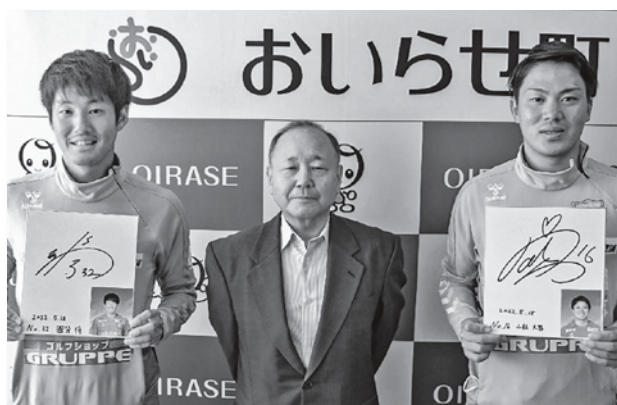
▲左：国分選手（北海道出身、背番号32番）、右：小林選手（大阪府出身、背番号16番）

両大使は「これから、町内の各イベントや店舗に行き、おいらせ町の魅力を発信していきたい」と意欲を話してくれました。