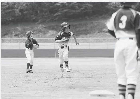
▲ 三塁まで全力疾走!