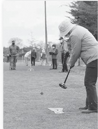
▲ホールポスト目掛けてショット！