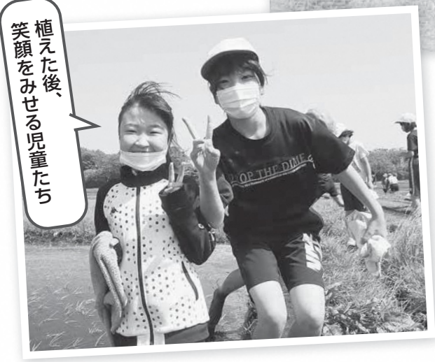
植えた後、笑顔を見せる児童たち