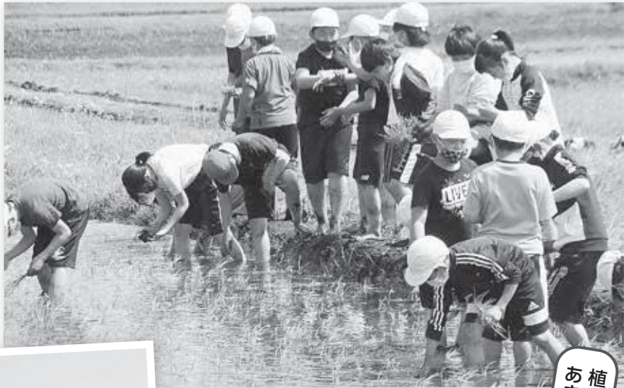
植えた品種は、あきたこまち

田植え体験は、自然や農業とのふれあいと学習のために、20年以上も前から続いています。