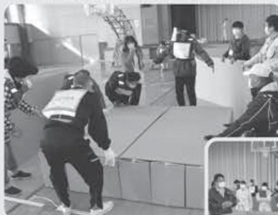
段ボール製のパーティションとベットを設置します。