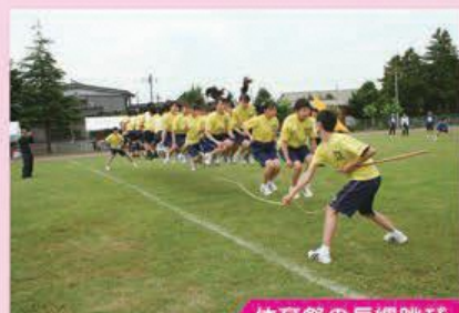
体育祭の長縄跳び

他の学校では行事が中止になることがある中、感染防止対策を徹底し、この状況下でも楽しめる行事を創り上げることができました。