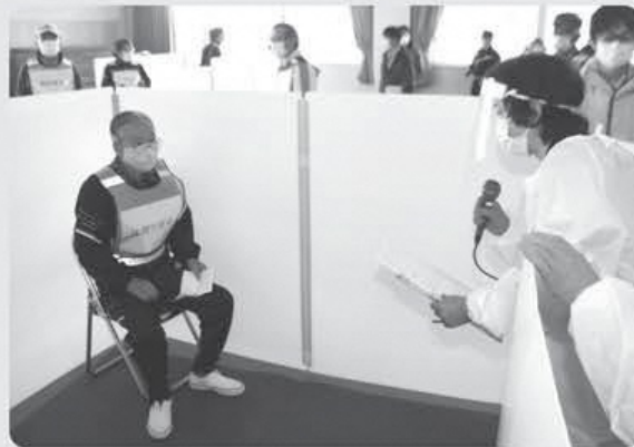
◀ 体調不良者は、交流館へ移動。プライバシースペースを用意し、保健師が容態などを確認します。