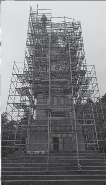
▲工事の様子です。12月中に工事が終わったので、ぜひ見に来てね!