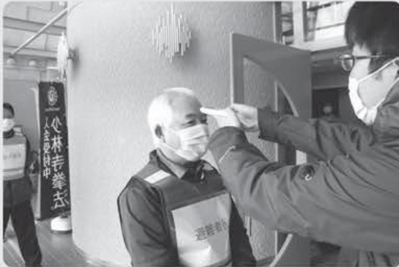
▲ 検温の様子。ここで、発熱などの体調不良者がいた場合は、別の場所に誘導します。