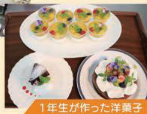
1年生が作った洋菓子