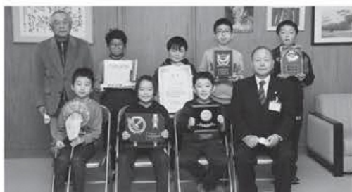
受賞を報告した町少年少女アイデアクラブ▶

11月27日に受賞の報告を受けた教育長は「発想がとてもしばらしい。これからも楽しんでください。」と今後の発明に期待しました。