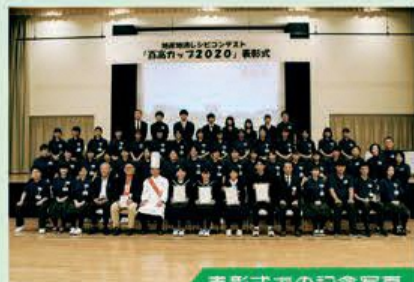
表彰式での記念写真

表彰式には、4人の受賞者が参加しました。ルーレットでインタビュー順を決めて、受賞者に工夫した点を聞いたり、吹奏楽部の演奏や活動内容の紹介ムービーを流したりしながら和やかで楽しい表彰式ができました。