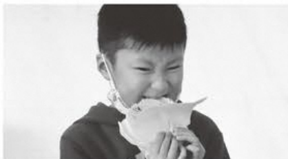
おいしくいただきました!