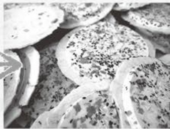
④完成!川越せんべい店では、「ふんわり手ごね、こんがり手やき」をモットーにせんべいを作っています。