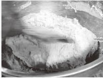
①タネ(麦のモチ)を作ります。水、塩、麦粉を混ぜ、ふんわりとなるように練ります。

一般的なせんべいは米からつくられていますが、南部せんべいは麦からつくられています。これは、この地域がやませ(偏東風)の影響で、米の生産量が少なかったからです。「南部せんべいは、米作に向かない地域で子どもを育てるため、女性たちが生み出した生活の知恵。それも南部せんべいの魅力の1つ。」と川越さんは話します。