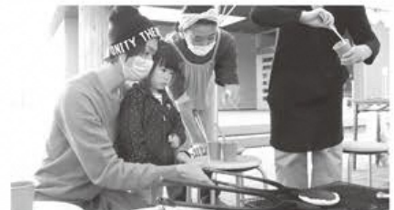
手焼き機を使って、せんべいを焼きます。