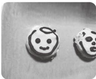
▲お馴染みのあのキャラクター(おいらくん)をつくりました。全身を集中して作ったせいか、23時になっていました。

試行錯誤の末、最後にチョココレトペンでキャラクターを描くところで、急に手が震えてしまい、何度も失敗しました。不器用です。でも、何年ぶりかのお菓子作りは、とても楽しかったです。