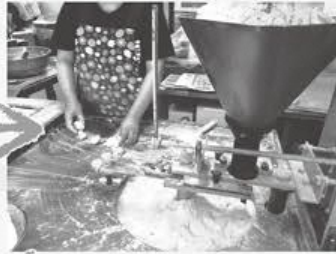
②練ったタネを切り分け、平たくします。