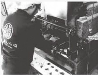
③石窯を使って焼きます。