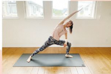
▲パールシュヴァコーナアーサナ（体側を伸ばすポーズ）。体幹強化、ウエストのシェイプアップなどの効果があります。