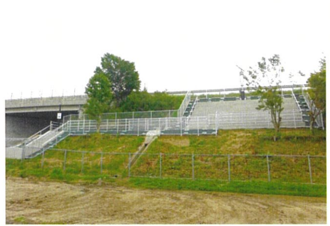
2号避難階段（ユニバース付近）