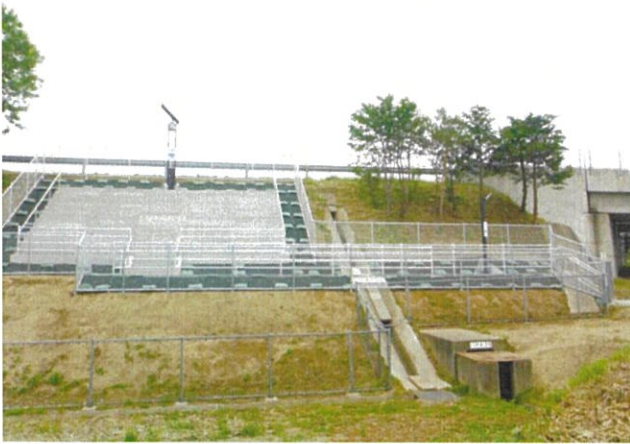
1号避難階段（法運寺付近）