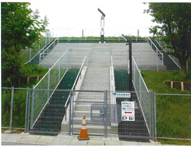
3号避難階段（秋堂町内）