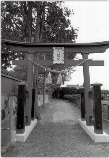
文／文化財保護審議会委員 戸賀澤幸子

鳥居とは（もと、神に供えた鶏のとまり木の義）神社の参道入口に立てて神域を示す一種の門。左右二本の柱の上に笠木をわたし、その下に柱を連結する貫を入れたもの。 丸太すなわち黒木を組合わせた原始的な黒木鳥居と、島木をつけた島木鳥居とに大別する。写真（若宮八幡宮）の鳥居は後者に属する。 古来より人々にとって鳥は「魂をはこぶ」象徴とされてきた。魂をはこぶとは