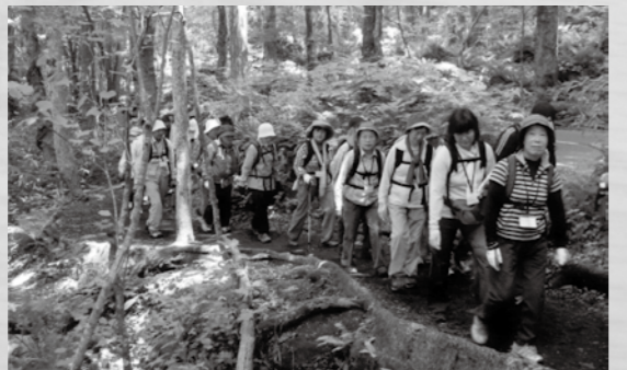
奥入瀬渓流を歩く

事前に保険を掛けるため4月1日以降はキャンセルしても返金できません。ご了承ください。