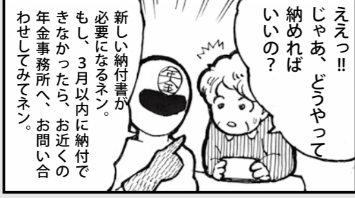
作/ Yuichi.T 画/ Ryo.O