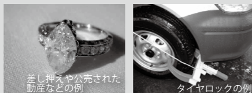
差し押えや公売された動産などの例