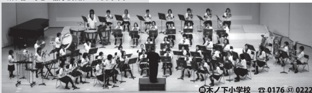
木ノ下小学校 ☎ 0176 57 0222