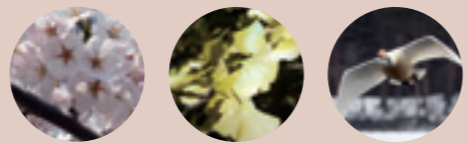
サクラ イチョウ ハクチョウ