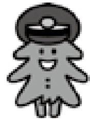
青い森鉄道のイメージキャラクター「モーリー」です。よろしくね

青い森鉄道の運行や営業などの計画、利用方法などに関する説明会を開催します。気軽に参加してください。