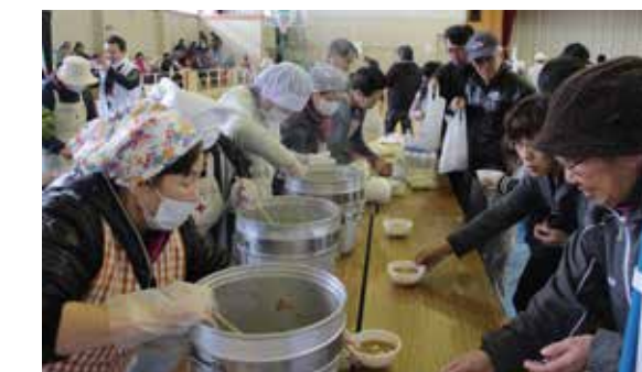
▲炊き出し訓練、アルファ米とだるま芋へっちょこ汁を準備

明神山周辺地区の大津波避難訓練やいちよう公園体育館前での展示訓練、県防災ヘリコプター「しらかみ」での吊上げ救助訓練見学など、多彩な内容の訓練を行いました。