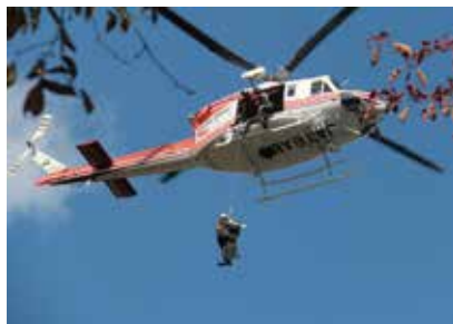
▲青森県防災航空隊は、防災ヘリ「しらかみ」で明神山防災タワー屋上から実際に人を吊上げる訓練を実施。