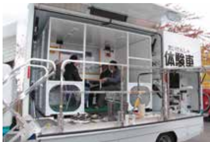
▲おいらせ消防署員による地震体験コーナーで、大きな揺れを体感。