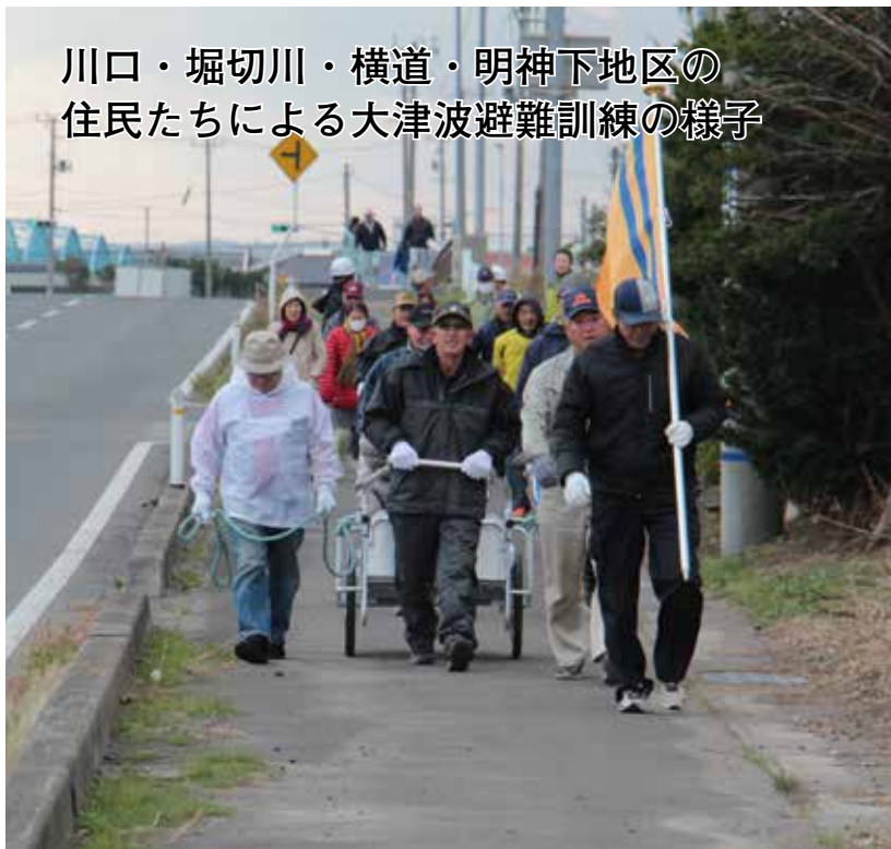
川口・堀切川・横道・明神下地区の住民たちによる大津波避難訓練の様子