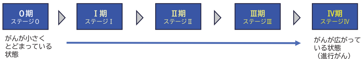
【図2】 がん細胞の成長と時間