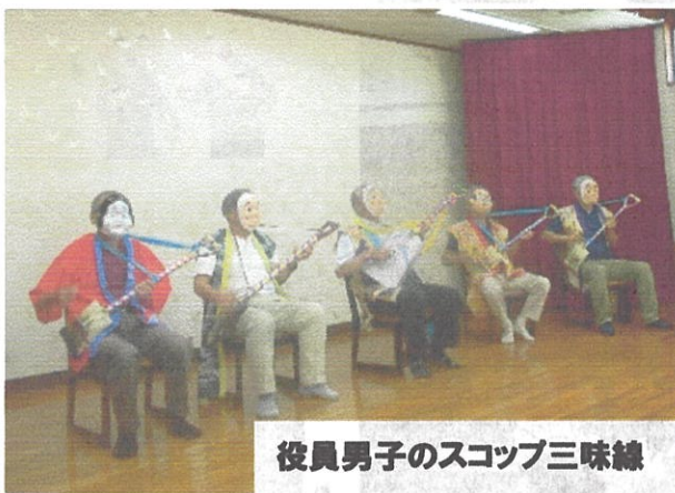
役員男子のスコップ三味線