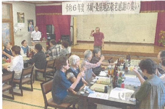
令和6年度 木崎・染屋地区敬老感謝の集い