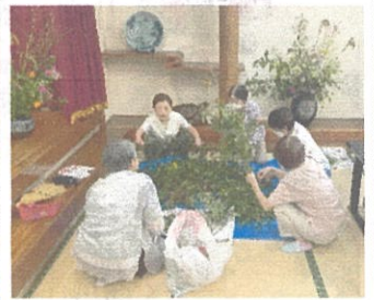
のぞみサマソング