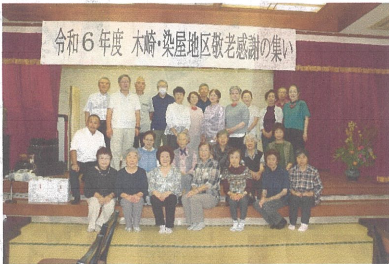
令和6年度 木崎・染屋地区敬老感謝の集い