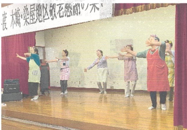
度 木崎・染屋地区敬老感謝の集い