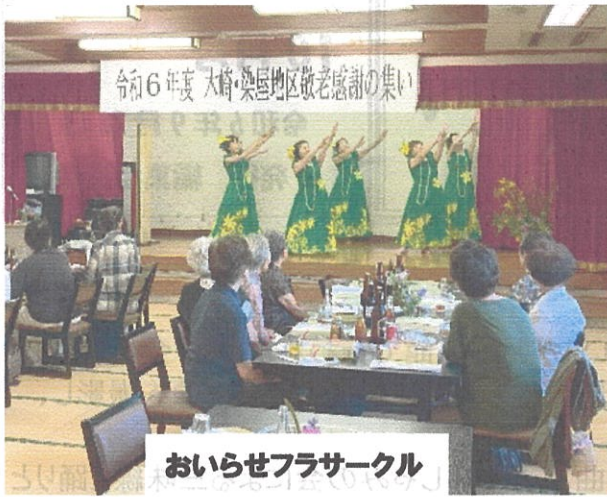
令和6年度 木崎・染屋地区敬老感謝の集い