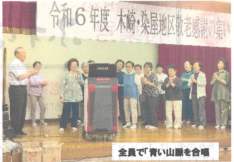
令和6年度 木崎・染屋地区敬老感謝の集い