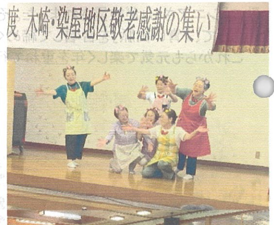
度 木崎・染屋地区敬老感謝の集い