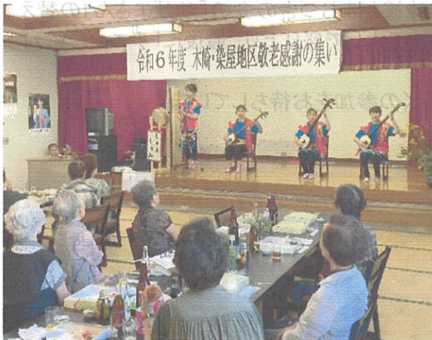
令和6年度 木崎・染屋地区敬老感謝の集い