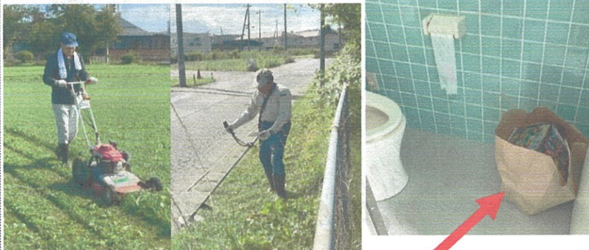
オモチャの空箱が入った紙袋

気になったことが1件あり、男性用トイレの中にオモチャの空箱が入った紙袋が置いてありました。誰が置いたか分かりませんが、このようなことはしないようにしましょう。