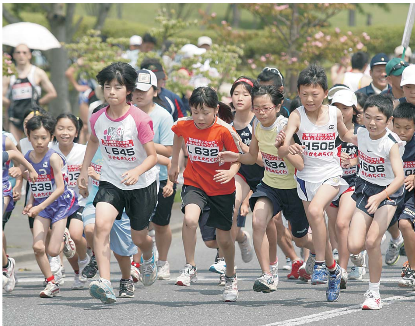
県内外から約400名が参加した「第24回おいらせ町いちょうマラソン大会」