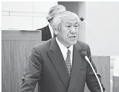
提案理由を説明する三村町長

平成二十一年第二回定例会は、六月五日から八日までの四日間の会期で開かれ、教育委員会委員の同意、条例の一部改正、消防ポンプ自動車購入契約の締結、小中学校楽器購入契約の締結、史跡阿光坊古墳群保存整備事業用地の取得、平成二十一年度一般会計及び特別会計の補正予算など、報告一件、議案十一件が上程され、審議の結果いずれも原案のとおり可決しました。一般質問には、一人の議員が登壇し、町当局の所見を求めました。