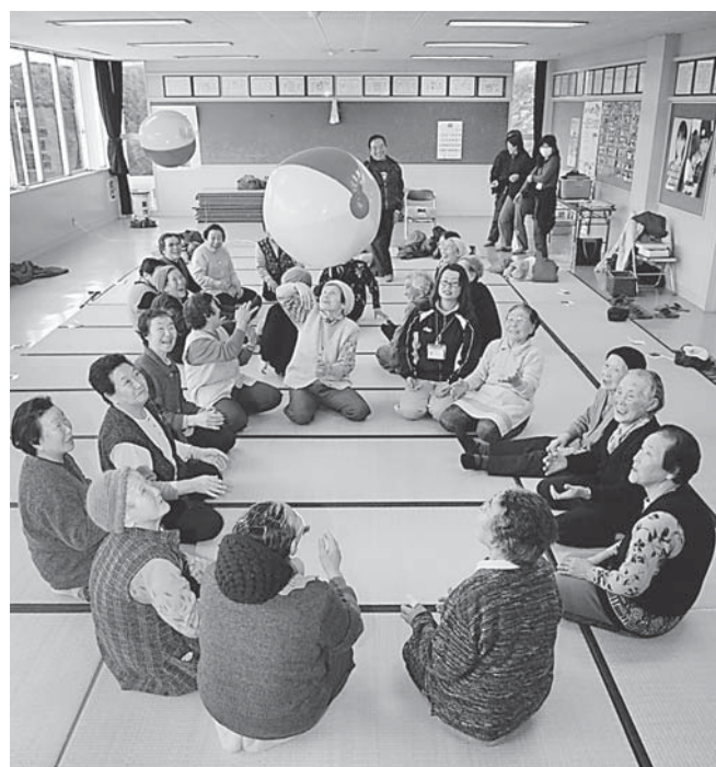
65歳以上人口約4,900人 (これはイメージ写真です。)