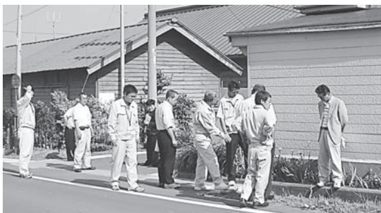
生活関連道を現地調査する委員一行