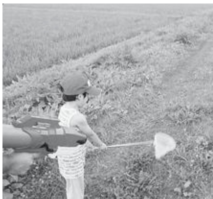
▶「虫捕りに励む少年」

記事作成のため、町の消防団員にインタビュー(関連4～5ページ)しました。諸事情により掲載を見送りましたが、ある消防団関係者から「消防団は火消しが仕事。でも、心の火(情熱)までは消せない。君もハートを燃やそう」と熱い言葉をもらいました。ありがとうございます。町を守るために活動している消防団員は、頼れる存在だと感じました。これから暑い夏がやってきます。私も情熱的に頑張りたいです。そして、燃え尽きたり、別の意味で炎上したりしないように気をつけたいです。