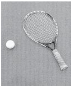
▲バウンドテニスのラケットは短いです。