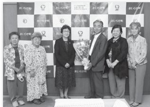
種市会長（左から3番目）から花束を受け取った成田町長▶

花束を受け取った成田町長は「いつもありがとうございます。町を代表して、お礼申し上げます」と話すと、種市会長は「去年から新型コロナウイルスの感染予防対策や経済対策など、心身ともに休まる暇がないかと思えます。お体に気を付けて頑張ってください」と激励の言葉を伝えていました。