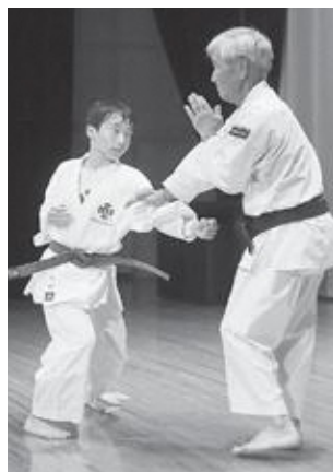
▶護身術教室の様子