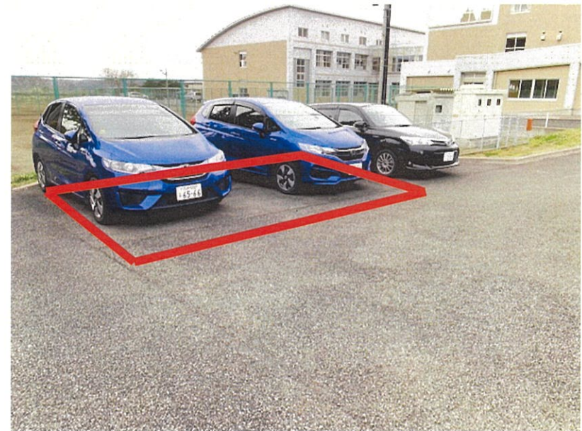
設置位置概要写真