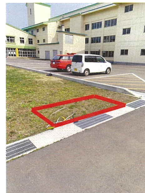
設置位置概要写真