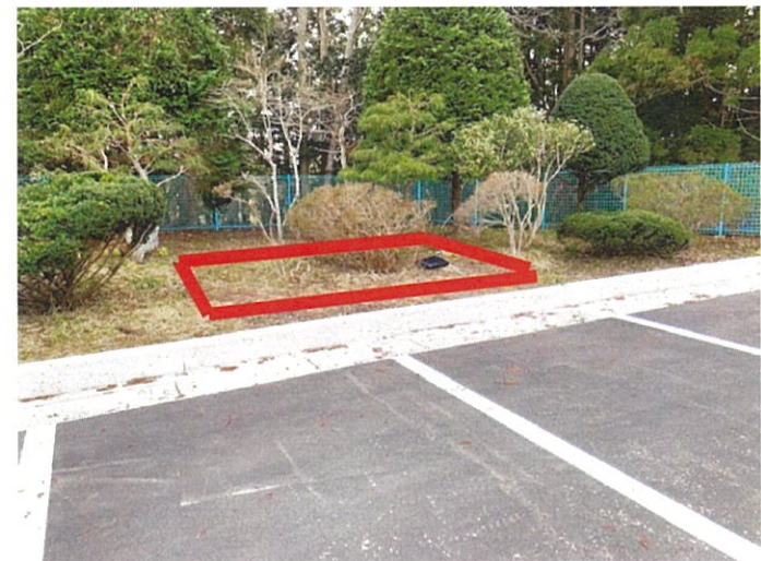
設置位置概要写真