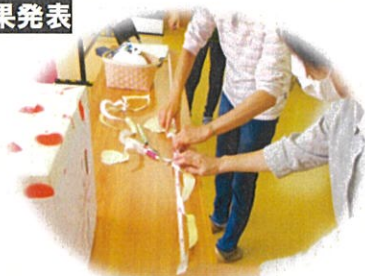
皮の長さ、厳正なる計測中