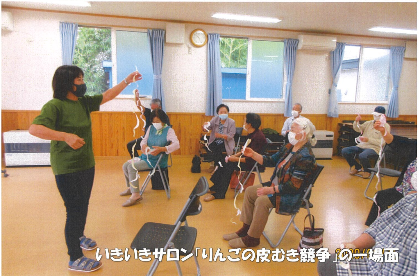
いきいきサロン「いんごの皮むき競争」の一場面