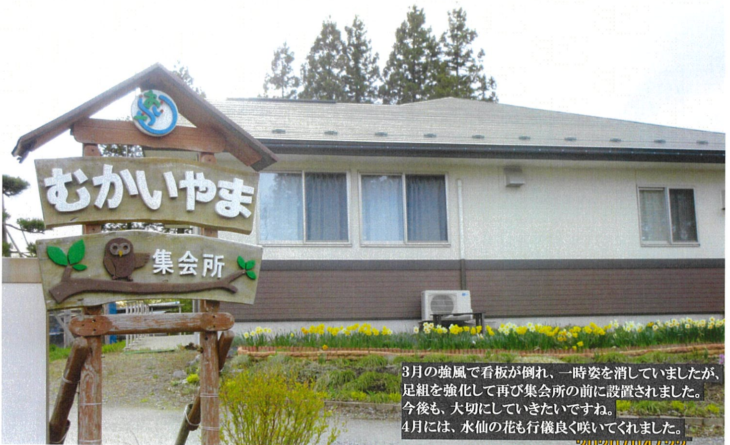
3月の強風で看板が倒れ、一時姿を消していましたが、足組を強化して再び集会所の前に設置されました。今後も、大切にしていきたいですね。4月には、水仙の花も行儀良く咲いてくれました。