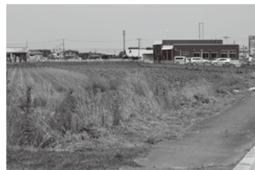
▲草刈だけでなく、路上にポイ捨てされたごみなども拾って歩く。