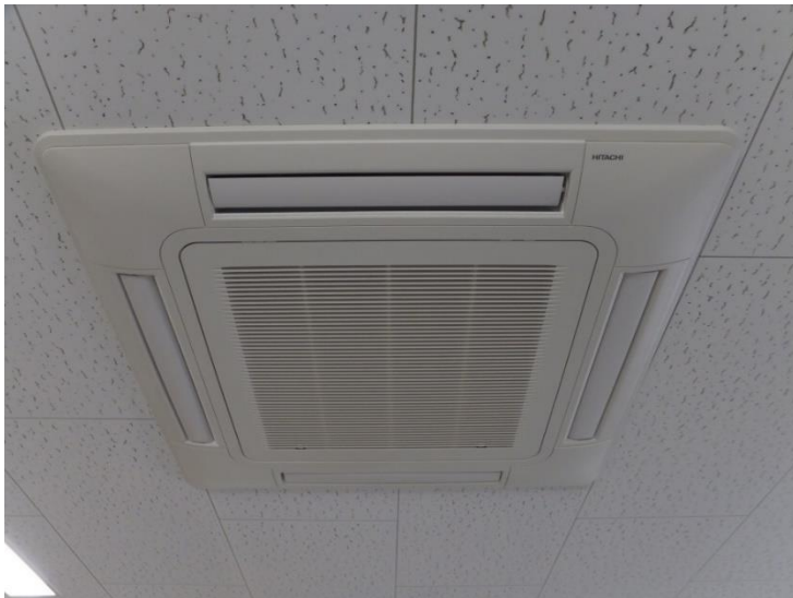
屋内機 天井埋め込み型