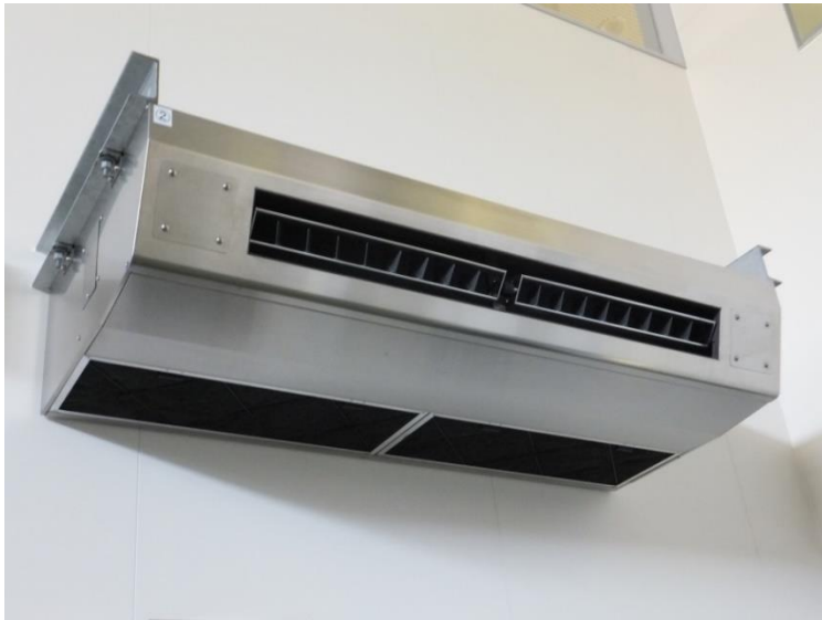
屋内機 厨房用エアコン