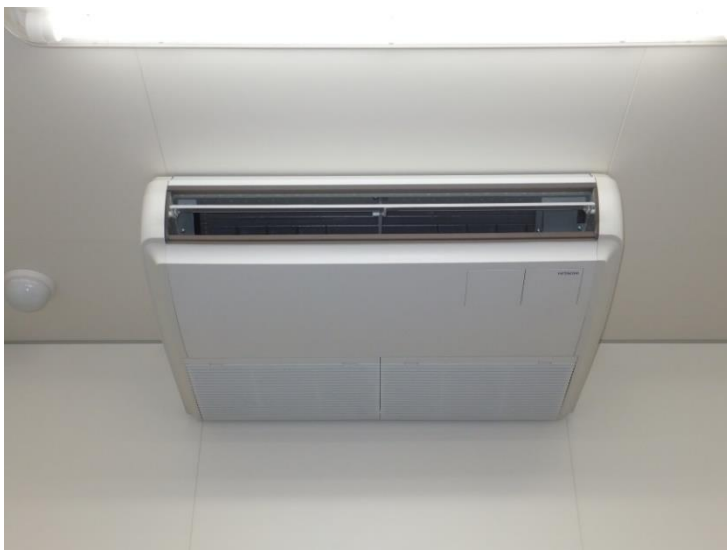
屋内機 天井吊り型